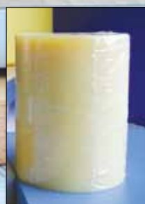
KLEIBERIT 782.5 Supramelt Cartouche de colle thermofusible transparente. Demandez la fiche technique du produit.

Ce produit a été contrôlé et validé par les labora- toires des sociétés HOLZ- HER et KLEBCHEMIE.